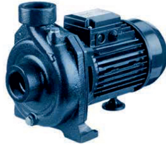
CMC, CMR 1.00 M

الکتروپمپ سانتریفوژ چدنی تک پروانه ای در دو مدل وارداتی ساخت ایتالیا و تولید داخلی با برند ABR مناسب افزایش فشار آب برای آبیاری و جهت کار با سیالات غیر خورنده برای مصارف معمولی و صنعتی