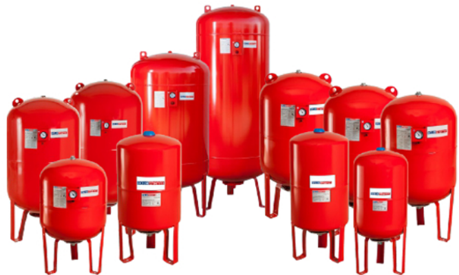
منابع ایستاده پایه دار Dik Ayaklı Tanklar