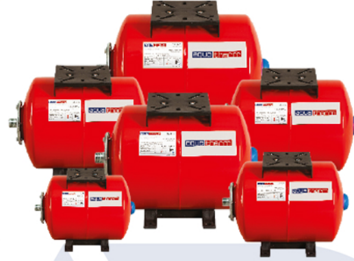
منابع افقی Yatık Tanklar