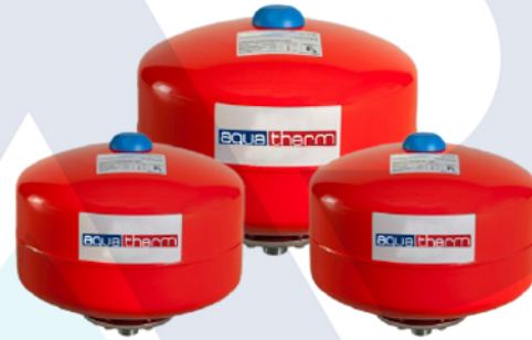
منابع ایستاده بدون پایه Dik Ayaksız Tanklar