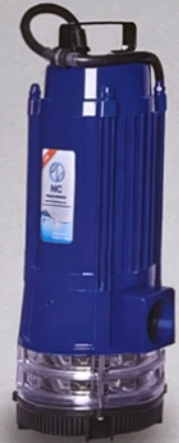
stainless Steel impeller